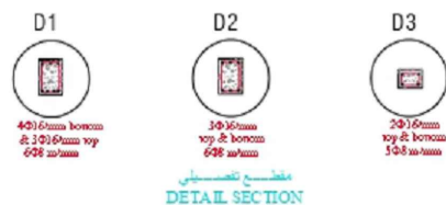
CROSS SECTION(B-B) - MODEL (A)

طبقة فيسول السطح لفيصل بين الخرسانة العائدية ارتفاع 10cm 10 cm high plain concrete slope layer for the building's roof طبقة التت بحريتي مع السواد التصفية Bahraini flat material with tape item بطانة خرسانة مسلحة ارتفاع 15cm Slab Reinforcement Concrete Thickness 15 cm